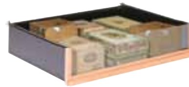
Tiroir de rangement Storage drawer

La Cave à Cigares est étudiée pour être évolutive. Plusieurs types de rangements vous sont proposés pour répondre au mieux à vos besoins.