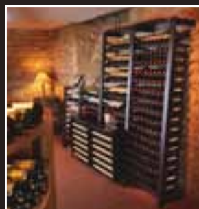
Rangements et Climatiseurs de Cave Storage Systems & Cellar Conditioners