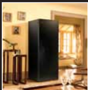
Caves à vins - Gamme Première Wine Cabinets - Première Range