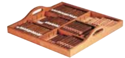
Plateau de présentation sur clayette coulissante (en bois exotique imputrescible). Presentation tray on sliding rack (in rot-proof exotic wood).